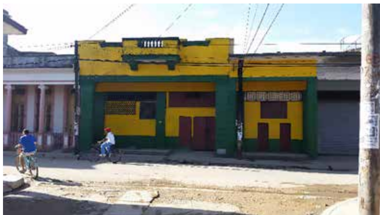
La actual estatalizada panadería (antes La Reina) en la calle Maceo (2017).