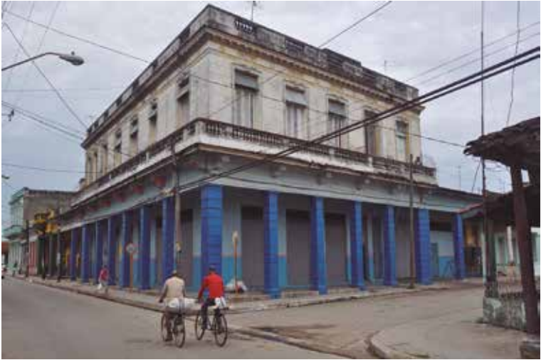
Güines, 2017: Foto actual de lo que fue, hasta 1962, la Bodega, almacén y panadería La Reina, situada –entonces– entre las calles Masó (derecha) y Maceo (a la izquierda). Hoy la dirección es: Calle 84, esquina a la Avenida 91.