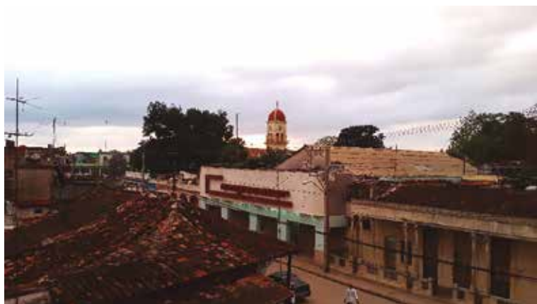
Foto tomada recientemente (2017) desde la casa natal del autor donde puede verse el cine Campoamor (actualmente cerrado) y a su derecha la que fue la bien surtida farmacia Chambless, convertida hoy en casa. Esta es la vista que tenía cotidianamente el autor de este libro, desde el balcón de su casa. Han pasado 57 años y está todo igual, aunque más deteriorado.