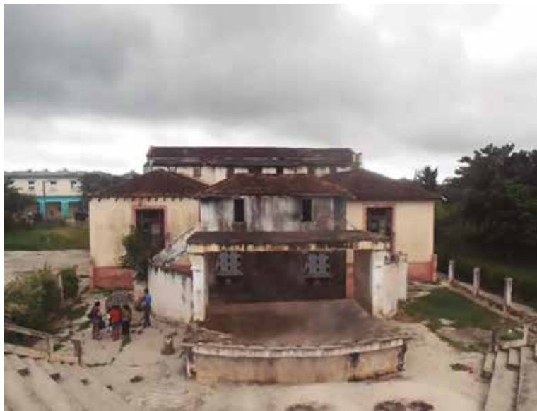
Güines (2016): Foto del Colegio americano (KPBM) y su anfiteatro totalmente destruido por la desidia estatalista.