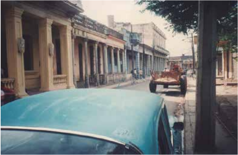
Güines, 1990: Calle Maceo (conocida también como Reina). A la izquierda, la Logia Masónica de Güines. Al final de esa misma acera, en la otra esquina, la que fue la Bodega La Reina y, encima de esta, la casa natal del autor. A la mitad de esta calle y en la misma acera izquierda (y en azul) la panadería, entonces con el mismo nombre, y desde 1962 estatalizada.